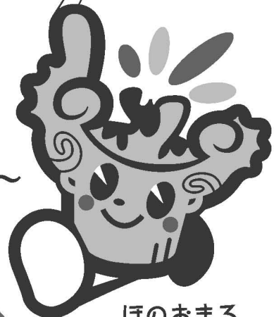
ほのおまる 国宝 火焰型土器 マスコットキャラクター